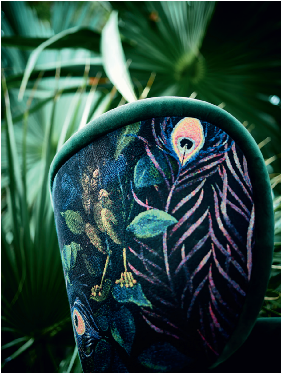
> FREIFRAU ONA CHAIR | OASIS GOBELIN