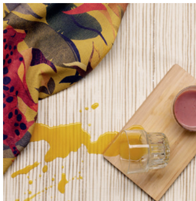
> MARIAFLORA FANTASIA OUTDOOR

Sprechen Sie mit uns über Ihre Visionen – wir kümmern uns darum, sie wahr werden zu lassen. —