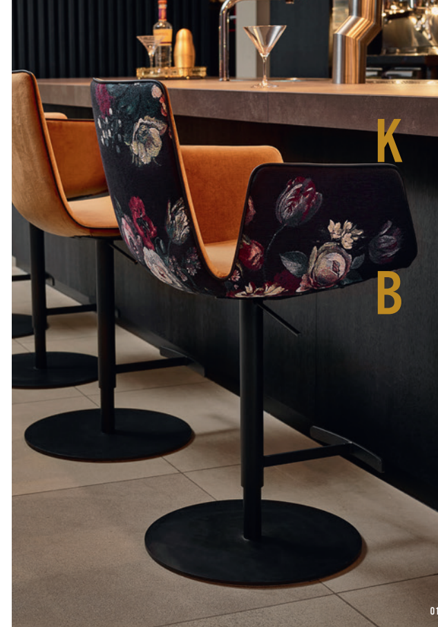
> 01 FREIFRAU ARMCHAIR HIGH | GOBELIN EDEN MEISTERWERKE HOTEL BAR MAURITZHOF MÜNSTER

> LEIDENSCHAFTLICHER TEXTILER, DER SICH FÜR DEN ERHALT DER HANDWERKLICH TEXTILEN WERTE EINSETZT. MITGRÜNDER UND GESCHÄFTSFÜHRER DES LABELS MEISTERWERKE – CREATORS OF FINE WOVEN ART. <