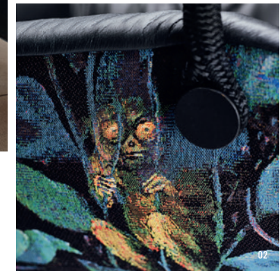
> 02 FREIFRAU LEYA SWING | GOBELIN OASIS MEISTERWERKE